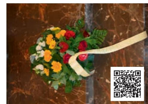
Blumengruß in den Farben rot-grün (Italien), gelb (Ukraine) und weiß-blau (Bayern) im „Monumento“ von Asiago mit der Schleife „Gheebar mitanandar“

In Begleitung von Gianluca Rodeghiero, ital. Beisitzer des Kuratoriums, startete der Sonntagvormittag mit dem Besuch einer Käseerei und interessanten Gesprächen über die Weidewirtschaft auf den Hochebenen. Am Ziel Asiago angekommen, führte der erste Weg der Reisegruppe zum „Monumento“, wo in einer kleinen Zeremonie mit Niederlegung eines Blumengrußes an die insgesamt 54.285 Soldaten des 1. Weltkrieges (3 aus dem 2. Weltkrieg) gedacht und für die aktuell um ihre Freiheit, Sprache und Kultur kämpfenden Ukrainer Fürbitten verlesen wurden.