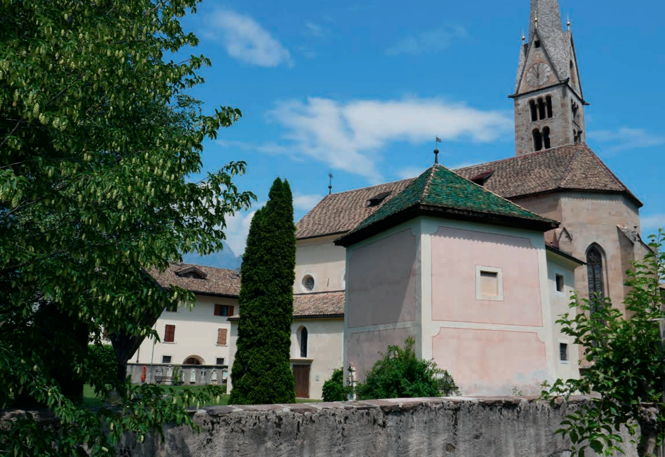
Kirche in Egna/Neumarkt, dem ersten Zwischenziel der Kulturfahrt 2022